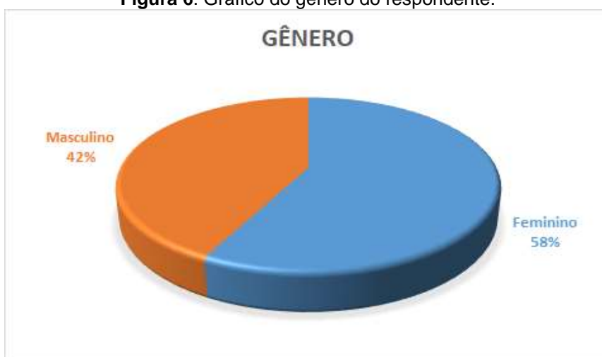
Figura 6. Gráfico do gênero do respondente.