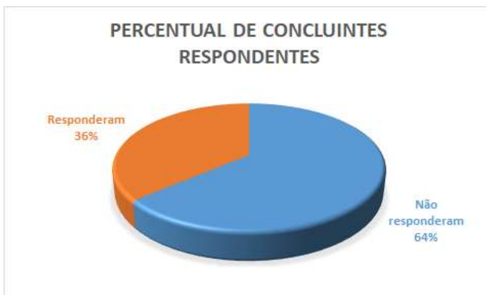
Figura 1. Gráfico do percentual de concluintes participantes da pesquisa.