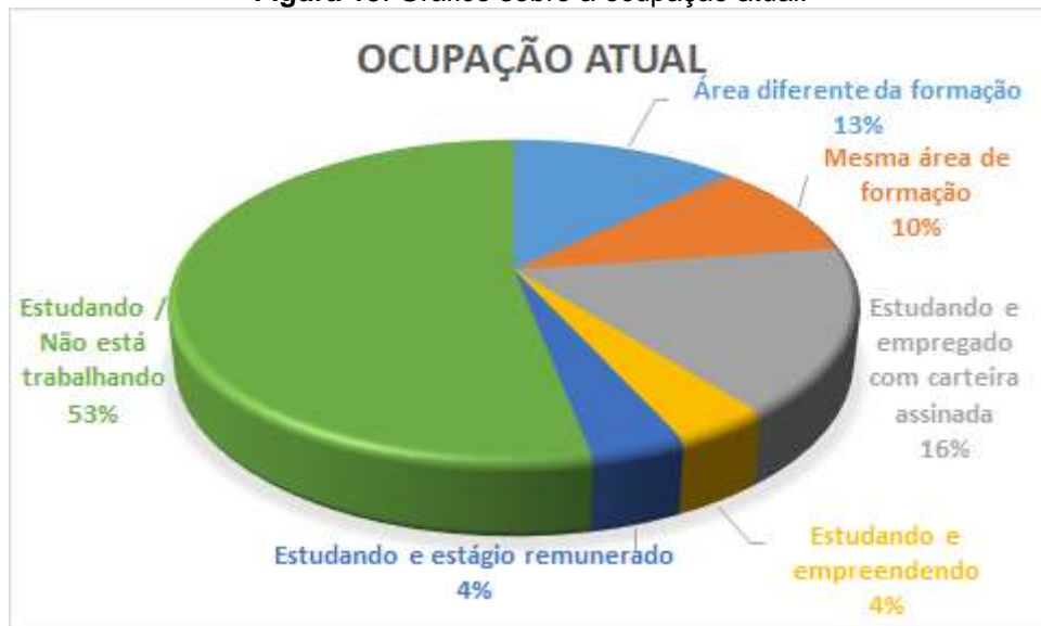
Figura 15. Gráfico sobre a ocupação atual.

Fonte: Banco de dados do cadastro de concluintes e da pesquisa de egressos - Campus Avançado Sombrio