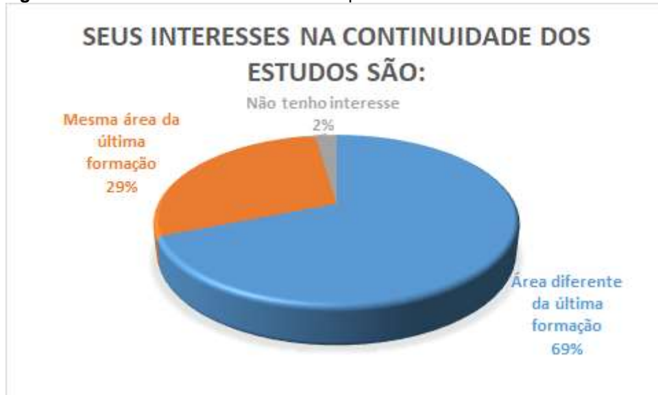
Figura 12. Gráfico sobre interesses do respondente na continuidade dos estudos.