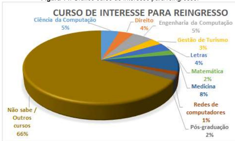
Figura 14. Gráfico curso de interesse para reingresso.