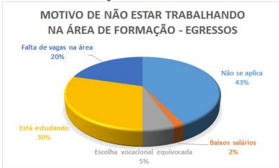
Figura 17. Gráfico do motivo dos egressos não estarem trabalhando na área de formação.