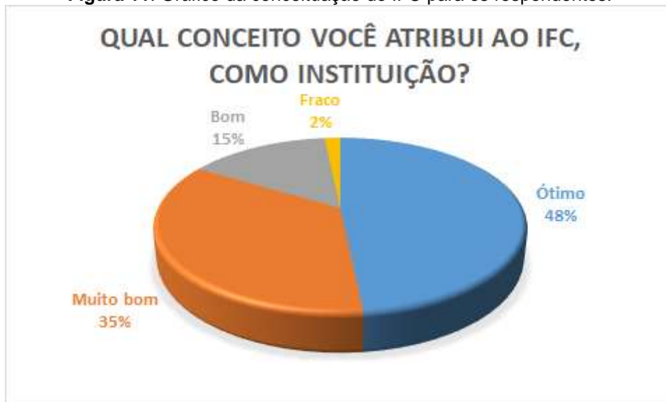
Figura 11. Gráfico da conceituação do IFC para os respondentes.