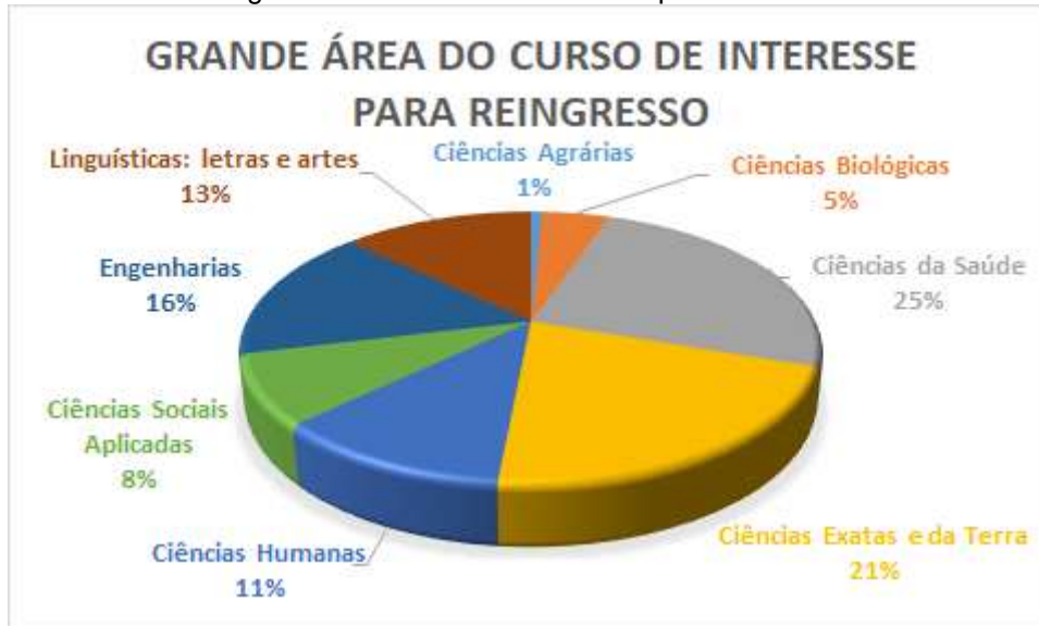
Figura 13. Gráfico sobre a grande área de interesse do respondente na continuidade dos estudos.