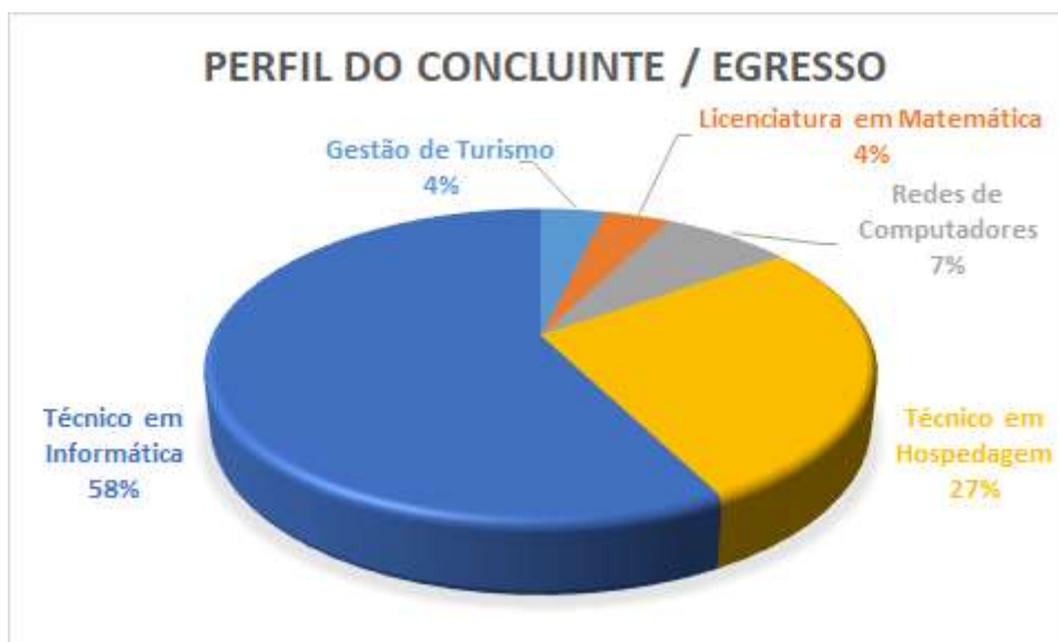
Figura 4. Gráfico sobre o perfil do concluinte / egresso.