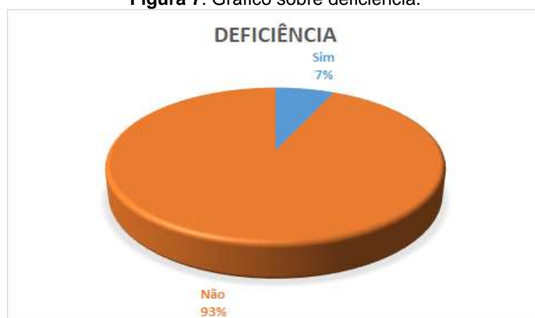
Figura 7. Gráfico sobre deficiência.