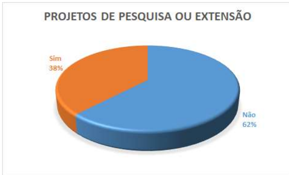
Figura 9. Gráfico participação em projetos de pesquisa ou extensão.