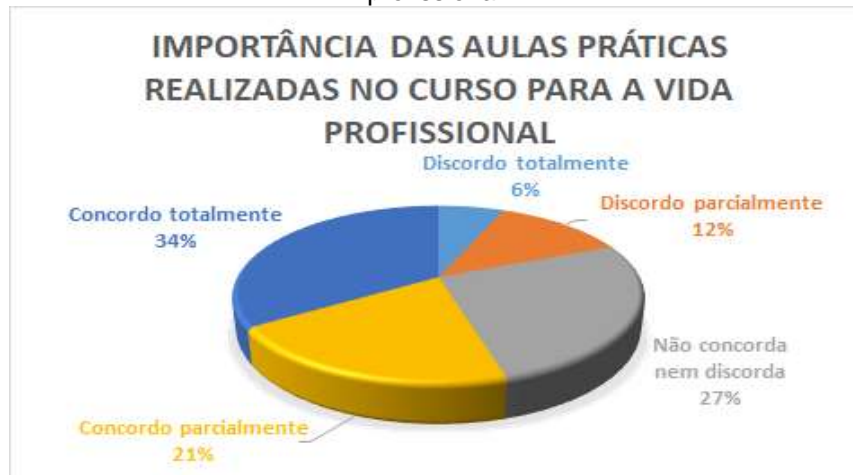
Figura 20. Gráfico sobre a importância das aulas práticas realizadas no curso para a vida profissional.