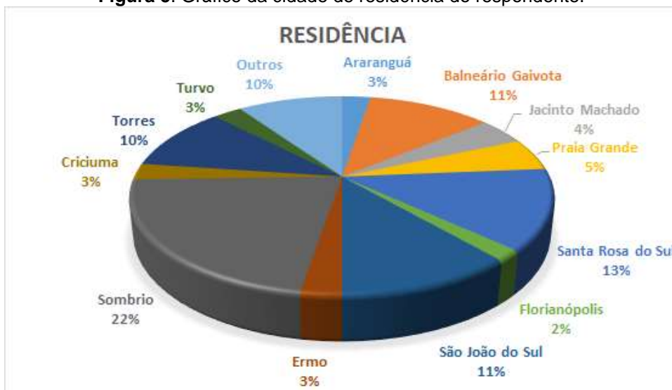
Figura 5. Gráfico da cidade de residência do respondente.