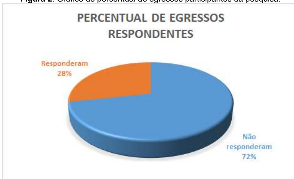
Figura 2. Gráfico do percentual de egressos participantes da pesquisa.