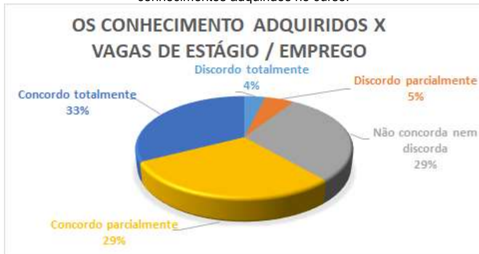
Figura 19. Gráfico sobre oportunidades de vagas de estágio / emprego proporcionadas pelos conhecimentos adquiridos no curso.