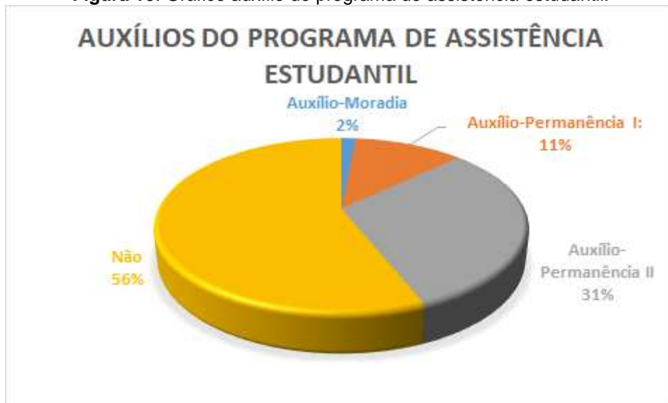
Figura 10. Gráfico auxílio do programa de assistência estudantil.