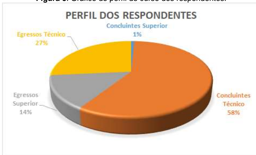
Figura 3. Gráfico do perfil de curso dos respondentes.