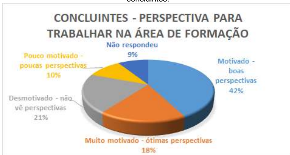
Figura 18. Gráfico da perspectiva ou motivação para trabalhar ou empreender na área de formação - concluintes.