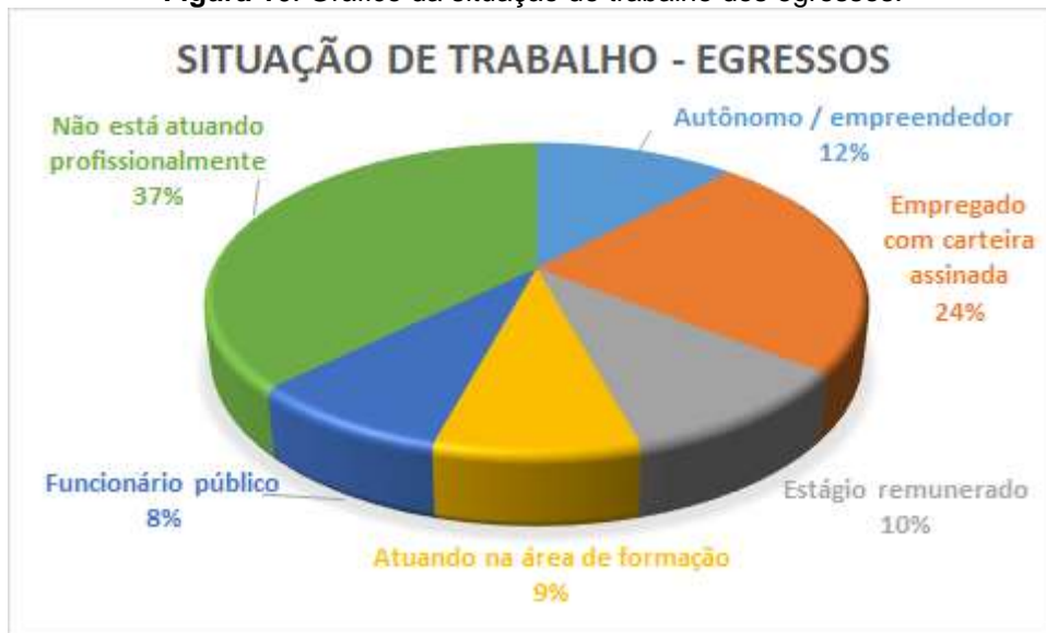
Figura 16. Gráfico da situação de trabalho dos egressos.